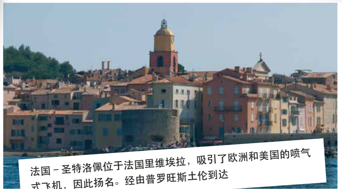
法国-圣特洛佩位于法国里维埃拉，吸引了欧洲和美国的喷气式飞机，因此扬名。经由普罗旺斯土伦到达