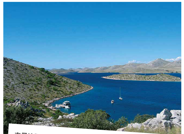
克罗地亚-科纳齐岛国家公园位于达尔马提亚。长35公里，有140座小岛。经由西贝尼克和扎达尔到达