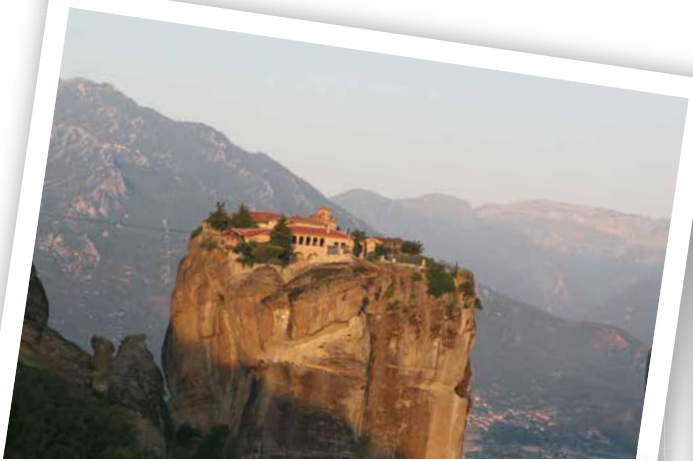
希腊-迈泰奥拉是希腊东正教修道院最大最重要的集聚地。建在天然的砂岩岩柱上。经由沃洛斯到达