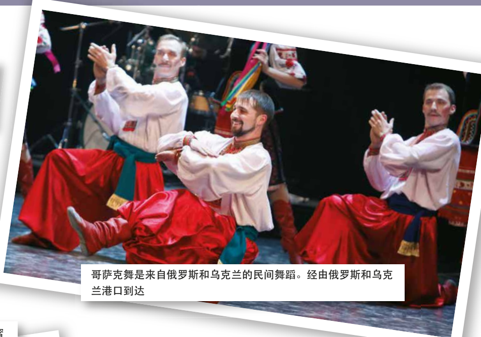
哥萨克舞是来自俄罗斯和乌克兰的民间舞蹈。经由俄罗斯和乌克兰港口到达