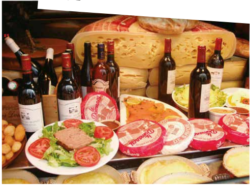
法国传统美食包含三道菜，一般为开胃汤、主菜、奶酪或甜品，配以本地生产的红酒。经由法国港口到达