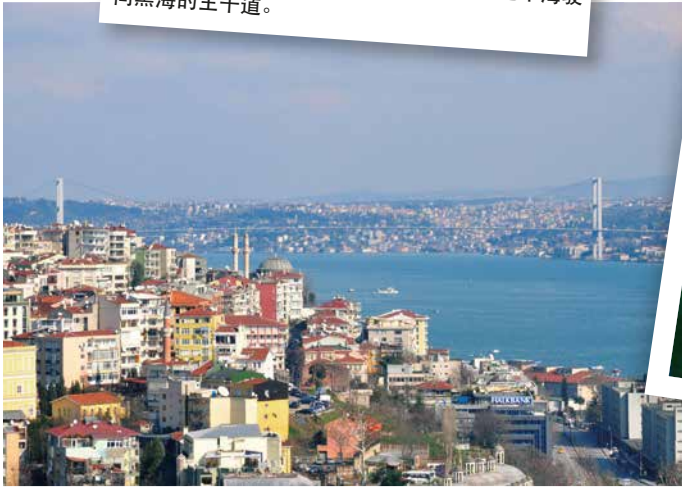
黑海 - 博斯普鲁斯海峡大桥是邮轮船舶从地中海驶向黑海的主干道。