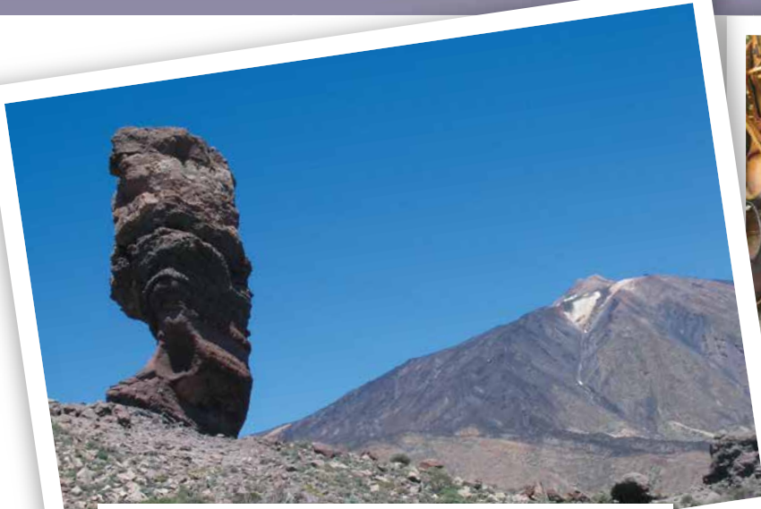
特纳利夫-泰德国家公园以西班牙最高峰、世界第三大火山0泰德山为中心，方圆约3718米，被联合国教科文组织列为世界文化遗产。经由特纳里夫圣克鲁斯到达