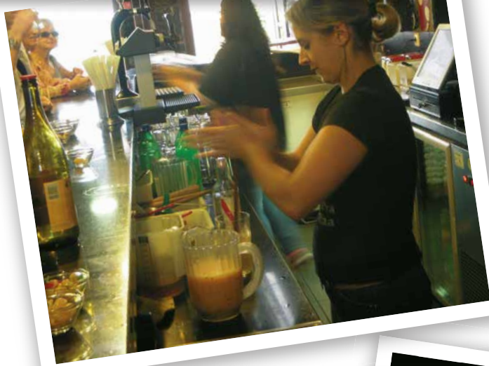
甘蔗糖醇是马德拉群岛的传统饮料，由甘蔗汁蒸馏出的酒、蜂蜜、柠檬汁和不同的果汁混合而成，不过柠檬汁是最传统的做法。经由马德拉港口到达