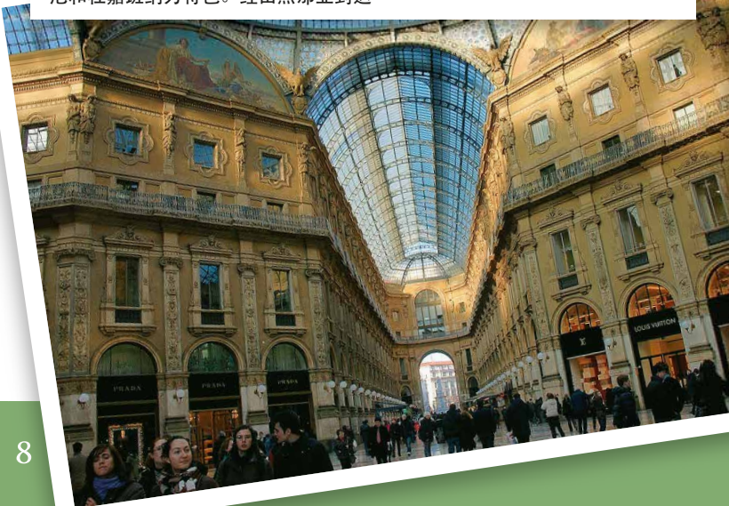
意大利-维多利亚二世拱廊是世上历史最悠久的购物中心，以普拉达、阿玛尼和杜嘉班纳为特色。经由热那亚到达