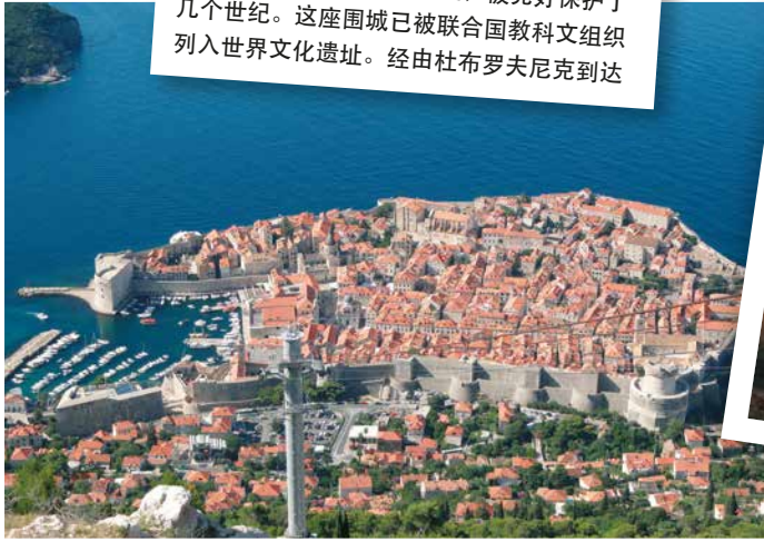
克罗地亚 - 在亚得里亚海的杜布罗夫尼克是建筑和文化杰作的无价之宝，被完好保护了几个世纪。这座围城已被联合国教科文组织列入世界文化遗产。经由杜布罗夫尼克到达