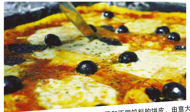
披萨是烤炉烘烤铺有番茄酱、奶酪和不同馅料的饼皮，由意大利那不勒斯人发明，已成为风靡全球的美食。经由意大利港口到达