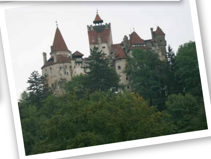
罗马尼亚 - 拜恩古堡，罗马尼亚众多古堡中的一个。是著名的“吸血鬼城堡”。经由康斯坦萨到达