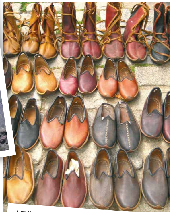
土耳其-土耳其出售大量皮制品，包括绒面服饰。经由土耳其港口到达