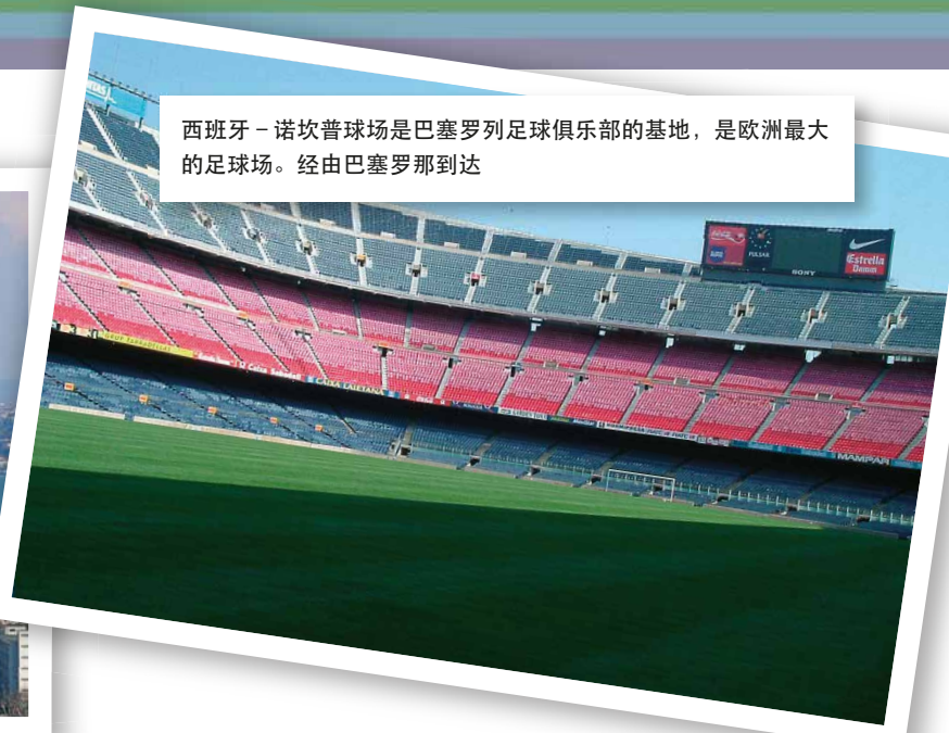
西班牙 - 诺坎普球场是巴塞罗列足球俱乐部的基地，是欧洲最大的足球场。经由巴塞罗那到达