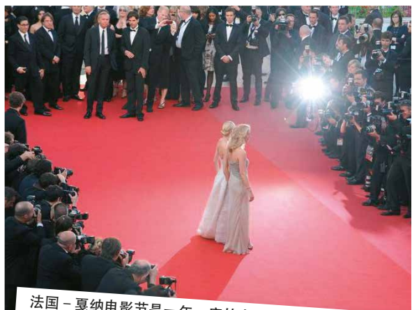
法国 - 戛纳电影节是一年一度的电影盛会，预告所有类型的影片。成立于1946年，是全世界最权威、最受关注的电影节。经由法国里维埃拉的港口到达