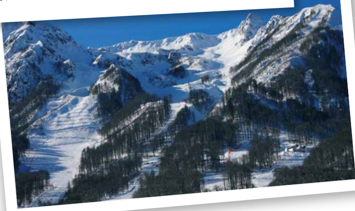
俄罗斯 - 2014年冬季奥运会计划2月在索契举办，一些比赛项目将在卡拉斯拉雅波利亚纳的旅游胜地地进行。经由索契到达