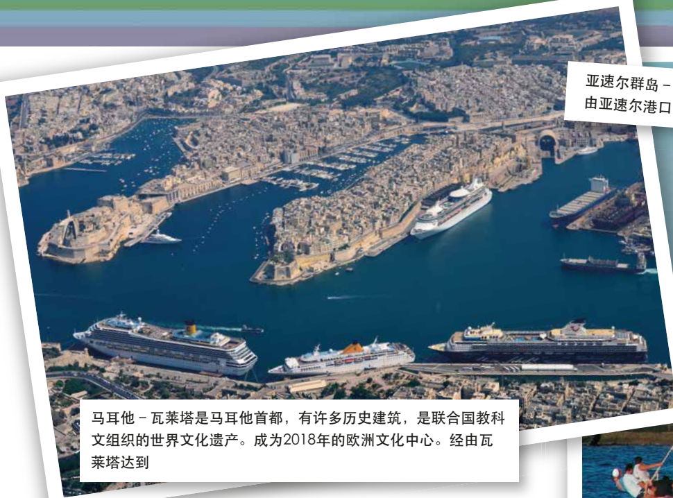
马耳他 - 瓦莱塔是马耳他首都，有许多历史建筑，是联合国教科文组织的世界文化遗产。成为2018年的欧洲文化中心。经由瓦莱塔达到