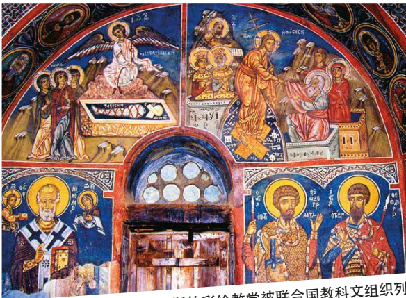
塞浦路斯 - 位于特罗多斯的彩绘教堂被联合国教科文组织列入世界文化遗产，由9座拜占庭教堂和一座修道院组成，内由拜占庭和后拜占庭风格的壁画装饰得富丽堂皇。经由莱梅索斯和拉纳卡到达